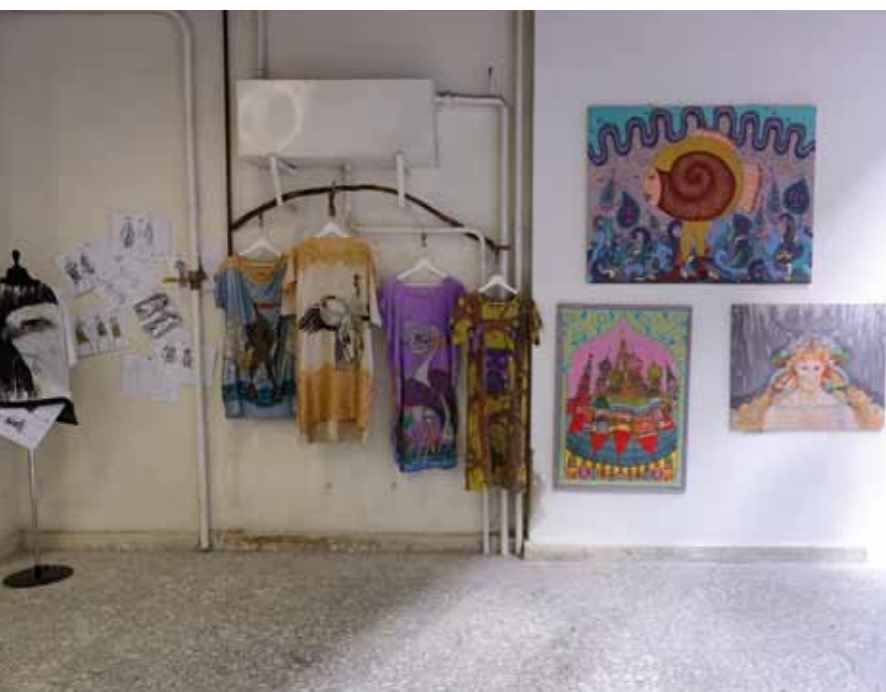
A Dohány utca 16–18. szám alatti Pop Up Galériában nyílt kiállításon több nemzet kultúrája találkozott, – lengyel, magyar, amerikai és német kortárs festők és iparművészek alkotásai is láthatók