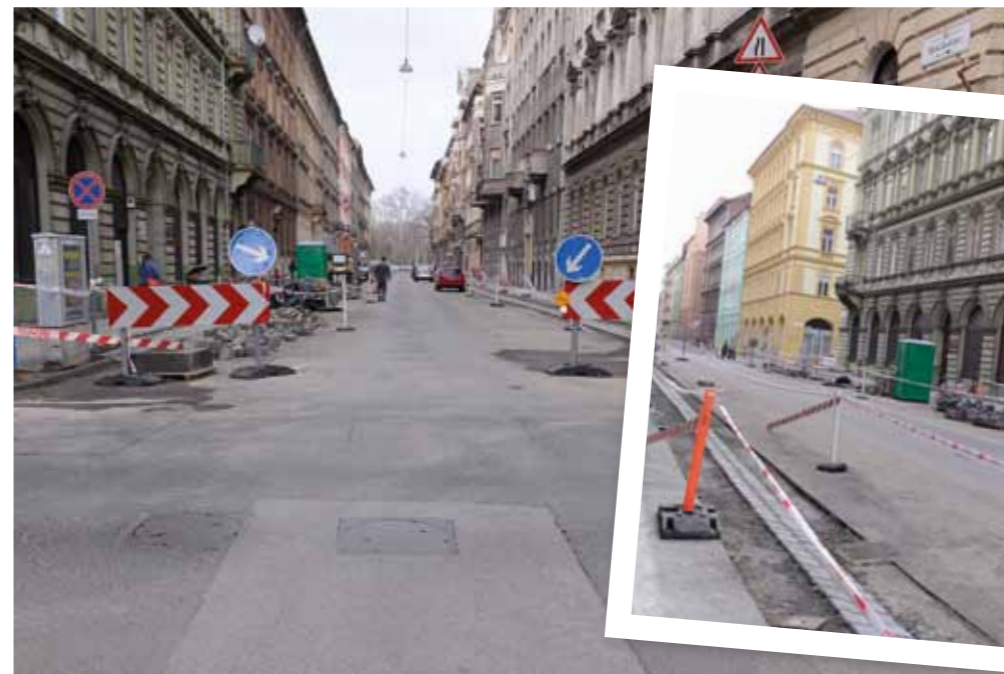
Megkezdődtek a Marek utca felújítási munkálatai

megértését kérjük! A felújítás eredményeként újabb utca válik élhetőbbé, zöldebbé Erzsébetvárosban, a kerületi lakosok és a kerületbe látogatók számára.