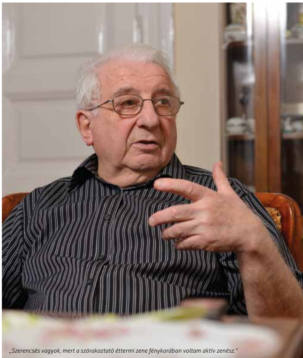
„Szerencsés vagyok, mert a szórakoztató éttermi zene fénykorában voltam aktív zenész.”

„1966-ban alapítottuk meg az Ungár zenekart, és olyan legendás helyeken léphettünk fel, mint az EMKE a Blaha Lujza térnél, ahová első alkalommal egy évre szerződtek bennünket. A kor összes nagy művésze megfordult ott akkoriban – meséli Ungár. Ma már legendásnak mondható művészek találkozó- és fellépő helyei voltak ezek a klubok, mások mellett Hofi Gézával, Korda Györggyel, Máté Péterrel dolgozhatott együtt a zenekar. Rengeteget jártunk külföldre, és mindenhol ragaszkodtam ahhoz, hogy a plakátokon hangsúlyoz-