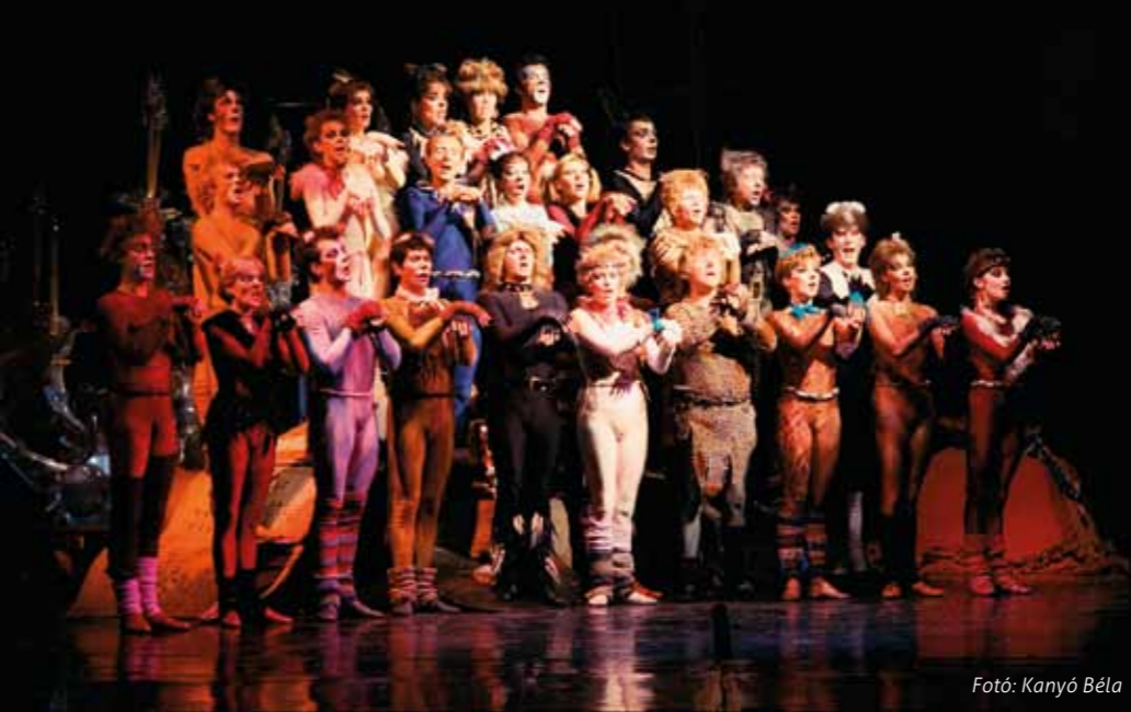
Macskák 1983 – az eredeti szereposztás